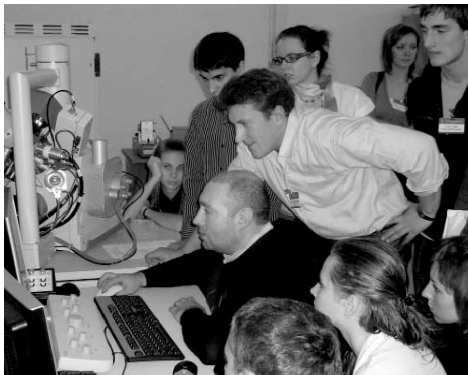
Фото 2. Участники школы-семинара студентов, аспирантов и молодых ученых по направлению «Нанобиотехнология» осваивают методы растровой электронной микроскопии.

Международной летней научной школе — «Нано 2009. Наноматериалы и нанотехнологии в живых системах», проходившей в Московской области летом 2009 г., сообщение было отмечено премией. На Всероссийской конференции «Устойчивость организмов к неблагоприятным факторам внешней среды», проходившей в Иркутске в августе 2009 г., доклад сотрудников лаборатории был отмечен дипломом (рис. 1).