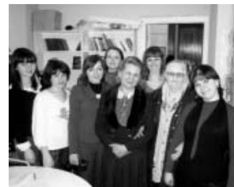
Петербург: Фонтанка, Невский проспект, Аничков мост, Васильевский остров и др.

Особый мир ключевых географических объектов России студенты-филологи постигают в рамках спецкурса «Топонимика и руссиеведение», совершая виртуальные путешествия по нашей стране. Например, при изучении темы «Московская топонимика во времени и пространстве» — необычная виртуальная экскурсия в Кремль, на Арбат и Смоленский бульвар. На занятиях студенты решают загадки названий Останкино, Лужанки и Китай-город, Лужники и Воробьевы горы; выясняют, почему Красная площадь «красная». Осмысливая тему «Топонимия Санкт-Петербурга: вчера, сегодня, завтра», студенты постигают имена и символы