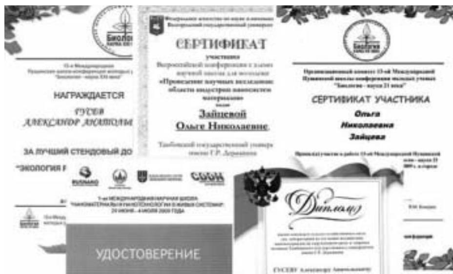
Фото 1. Сертификаты, дипломы и удостоверения сотрудников лаборатории по изучению воздействия наноматериалов на окружающую среду и здоровье человека.

Сотрудники лаборатории — авторы многочисленных научных публикаций, постоянные участники конференций всероссийского и международного уровней. На прошедшей в ноябре 2008 г. 12-й Международной Пущинской школе-конференции молодых ученых «Биология — наука XXI века» подготовленный сотрудниками лаборатории стендовый доклад был оценен оргкомитетом как лучший на секции «Экология растений и животных». На 1-й